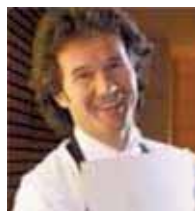
Carlo Cracco Ristorante Cracco in Milano Via Victor Hugo 4 20123 Milano tel. 02 876774