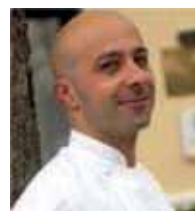
Niko Romito Reale Via Regina Elena 49 67036 Rivisondoli (AQ) tel. 0864 69382 www.ristorantereale.it