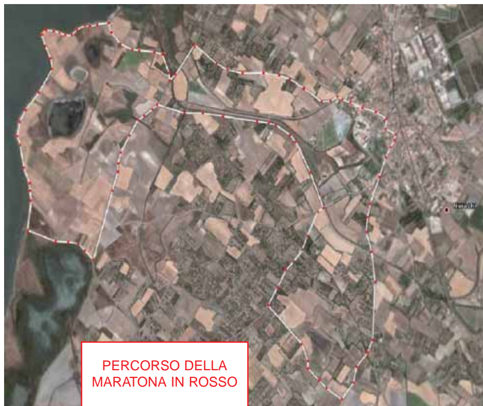
PERCORSO DELLA MARATONA IN ROSSO

per circa quaranta atleti, fatta eccezione per le spese di viaggio.